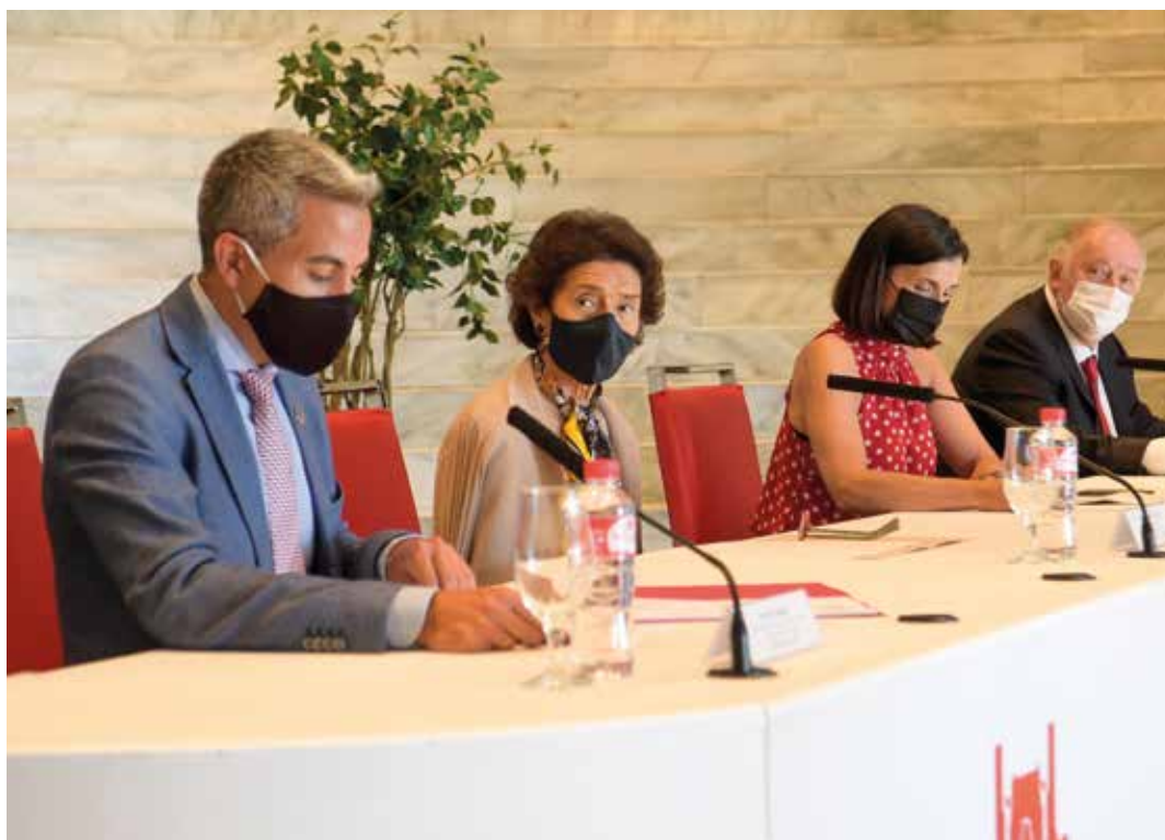
Rueda de prensa de presentación del Encuentro de Música y Academia de Santander 2021