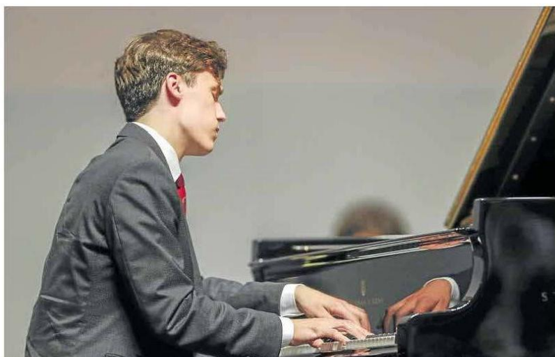
El pianista canadiense durante su interpretación en el Palacio de Festivales donde resultó ganador del Concurso Internacional de Piano. ALBERTO AJA

Los ganadores del XX Concurso han protagonizado 26 conciertos en reconocidas salas de 14 ciudades españolas como Burgos, Córdoba, Gijón, León, Madrid, Santander, Sevilla o Vitoria, y en 12 salas de diferentes ciudades de Argentina Hungría, Irlanda, México, Portugal, Suiza y Uruguay.